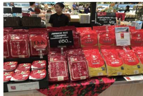
「ゆめぴりか」などの北海道米や無菌米飯を販売。

タイ米とは異なり、粘りが強い北海道米ですが、試食されたタイの方々からも「おいしい」という反応が大多数。来店者は富裕層が多く、高額商品も好評でした。試食して納得すると、価格には関係なくまとめ買いする姿も見られました。期間中に再来店してリピート購入される方もいて、ホクレンとしても大きな手応えを感じました。「北海道」は、自然、雪といったイメージで、バンコクでも広く認知されており、農産物に対しても好印象をもたられているようです。輸出拡大に、北海道のブランド力と品質は大きな力となります。