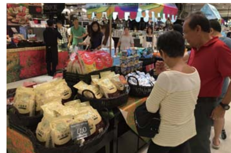
北海道米に興味津々のお客様。