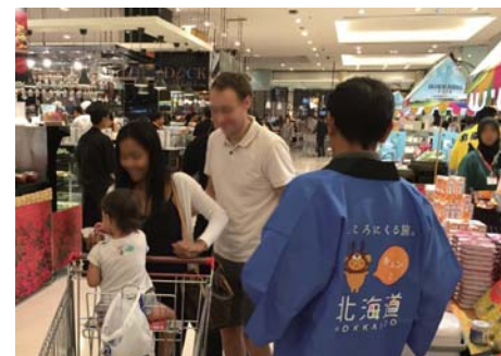
試食販売は大盛況! 食べた後、購入される方も多数。

タイには米の輸入量の規制があり、ホクレンは1社あたりの上限量である年300トンの輸出を目指しています。また、タイは外食文化が発達しているため、ぎょれんとも連携して、店頭販売だけでなく、外食産業や業務用向けの輸出拡大も図っていきたく考えています。ホクレンとぎょれんが海外事業で連携するのは初めて。ぎょれんは既に帆立などで海外市場を開拓しており、この連携も、北海道米の輸出拡大への強い味方となります。北海道米のおいしさを、アジアの方々にも味わっていただくために、認知度向上、普及に努めていきます。